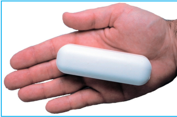
Abbildung 1: P-PILL®-Phosphor-Pille. 750 mmol Phosphor aus Natriumphosphat.