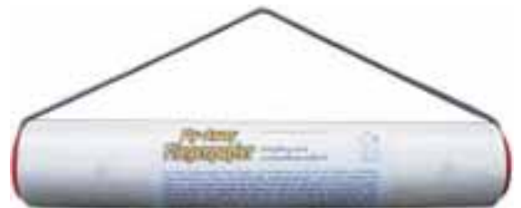
0,3 x 9 Meter Fliegenpapier / Rolle

Für weitere Informationen stehen wir Ihnen gerne zur Verfügung